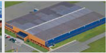
Hörmann Gadco LLC, Vonore TN, USA

De Hörmann-groep biedt, als enige fabrikant op de internationale markt, alle belangrijke bouwelementen uit één hand. Zij worden in hooggespecialiseerde fabrieken vervaardigd volgens de nieuwste stand van de techniek. Door het overkoepelende verkoops- en servicenet in Europa en de aanwezigheid in Amerika en China is Hörmann uw sterke internationale partner voor hoogwaardige bouwelementen. In een kwaliteit zonder compromissen.