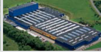
Hörmann KG Freisen