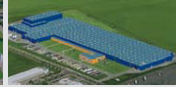
Hörmann KG Ichtershausen