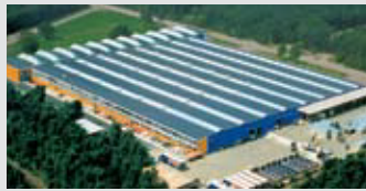
Hörmann Genk NV, België