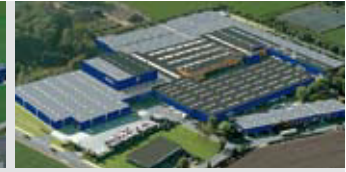
Hörmann KG Brockhagen