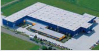
Hörmann KG Dissen