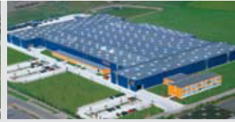
Hörmann KG Brandis