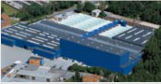
Hörmann KG Amshausen