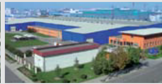
Hörmann Beijing, China