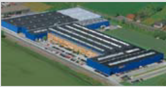
Hörmann KG Werne