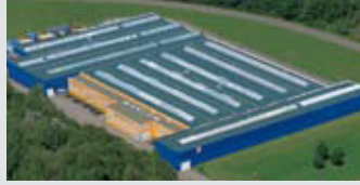
Hörmann KG Eckelhausen