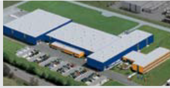
Hörmann KG Antriebstechnik