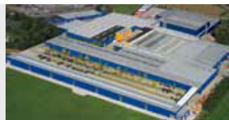
Hörmann KG Brockhagen, Duitsland