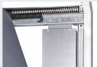
Veilige deurgeleiding in horizontale en verticale looprails, afgeremd openen en sluiten dankzij aanslagdemper