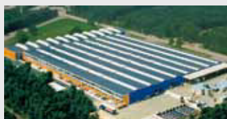
Hörmann Genk NV, België