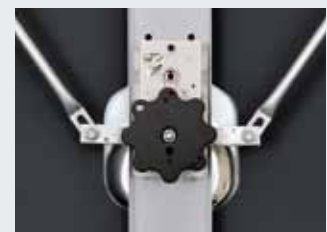
Binnenhandgreep, profielcilinderslot, vergrendelingsstangen aan de deurbinnenzijde, in de ruimte met de sporttoestellen