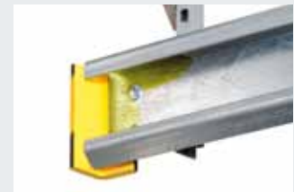
Stootveilig beklede looprailuiteinden