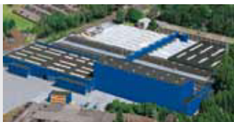
Hörmann KG Amshausen, Duitsland