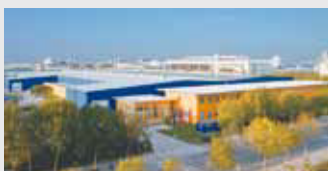
Hörmann Beijing, China