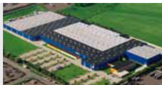
Hörmann KG Brandis, Duitsland