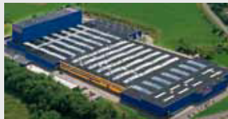
Hörmann KG Freisen, Duitsland