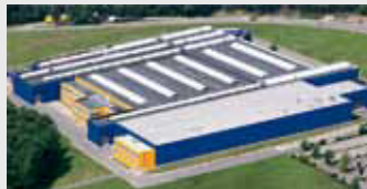
Hörmann KG Eckelhausen, Duitsland