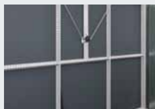
Stabiele constructie met rechthoekige kokers en horizontale versterkingsstijlen