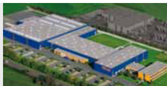
Hörmann KG Antriebstechnik, Duitsland