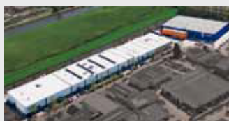
Hörmann Alkmaar B.V., Nederland