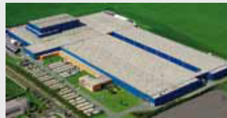
Hörmann KG Ichtershausen, Duitsland