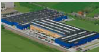
Hörmann KG Werne, Duitsland