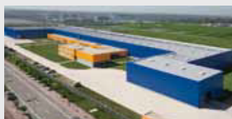
Hörmann Tianjin, China