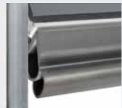
Elastische klembeveiliging tegen het kneuzen van de voeten