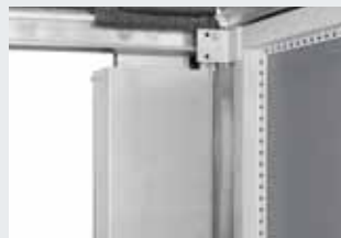
Compleet omsloten tegengewichten