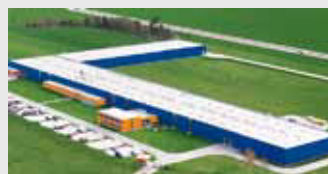
Hörmann Legnica Sp. z o.o., Polen