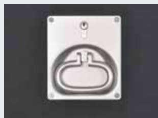
In hetzelfde vlak als de deurbekleding ingebouwde schelphandgreep, aan de halzijde